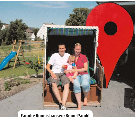
Familie Bögershausen: Keine Panik!

als Beamter, den Job verliert. Das verschafft uns deutlich mehr Sicherheit als anderen. Auch unsere Nachbarn sind junge Eltern mit Haus, meist Doppelverdiener, die alle ein zweites Kind planen. Wir befürchten keinen Abstieg, achten aber schon darauf, was was wir uns noch leisten können und was nicht.