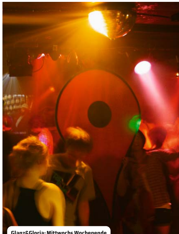
Glanz&Gloria: Mittwochs Wochenende

2.30 Uhr: Zwischen dem Start um 23 Uhr und dem Ende um 6 Uhr liegt die Mitte der Partynacht. Draußen hat ein Gewitter vor Stunden bereits die Luft abgekühlt. Das Clubinnere geht hingegen locker als finnische Dampfsauna durch. Der DJ hat trotzdem keine Mühe, die Tanzfläche zu füllen. Die Tänzer müssen auf ihre FlipFlop-Füße aufpassen. Eine hübsche Brünette im Blumenkleid tanzt mit einem chinesischen Fächer zu coolem Indierock und findet Nachahmer an der Theke, wo sich zwei Jungs mit Bierdeckeln Kühlung verschaffen. Gelbe und grüne Discostrahler scheinen. „Und darum lieben wir die Disco“, erklärt Jan Delay.